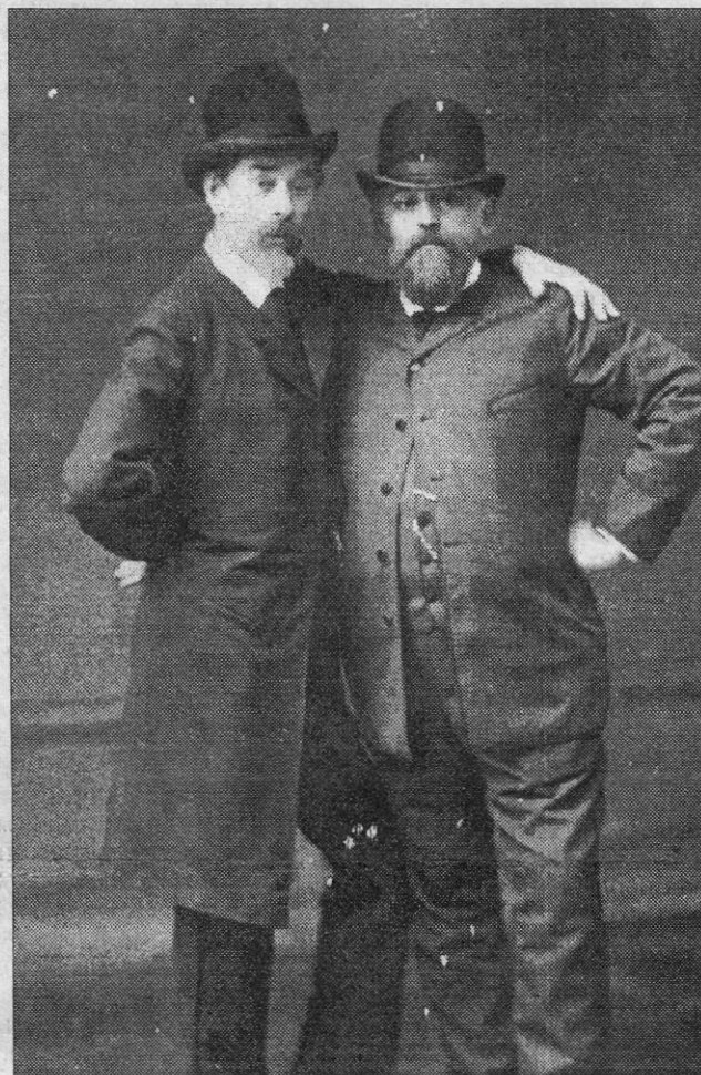
В. Д. Полenov и С. И. Мамонтов. 1880-е гг.