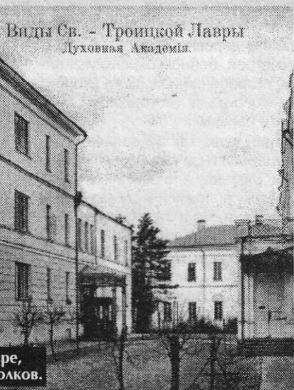
Виды Св. - Троицкой Лавры Духовная Академия.

Сейчас размышлял, что мы живем прямо-таки по-средневековому: полное отсутствие удобств, обеспеченности, уверенности в завтрашнем дне; разбой по ночам, лихоемство и ложь кругом, отчаянное одиночество и варварство. Но нет, я ошибаюсь. В истории нет дословных повторов. И если наша эпоха многим напоминает Средневековье, то есть в ней и элементы Возрождения: усиленная научная работа в отдельных оазисах, вроде Академии наук и подобных исследовательских институтах; изумительные мысли, переживания и достижения отдельных лиц. Счастливы те, кто в силах жить так. Вокруг меня нет и подобия такой атмосферы.